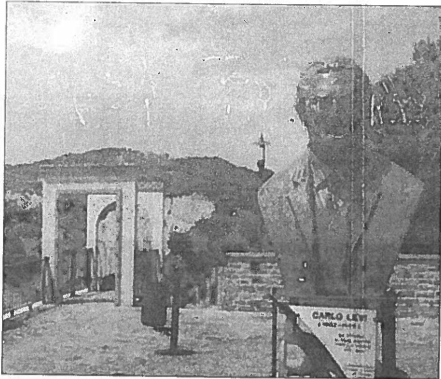
Il Parco "Levi" e il presidente Mattarella al Congresso della "Dante Alighieri"